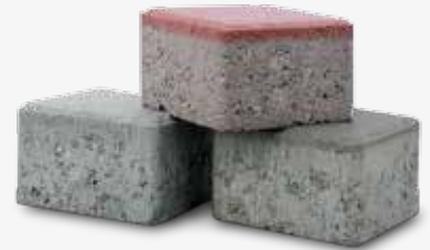
TTE®-Pflasterstein steingrau, rubinrot und anthrazit