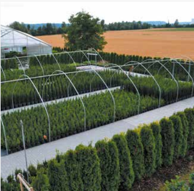
Kulturmatte und TTE®-System: die umweltschonende Lösung für Ihren Gartenbaubetrieb

Bodenstrukturverbesserung durch Einarbeiten von Sand und Zuschlagstoffen (Sprechen Sie uns an 01711968639)