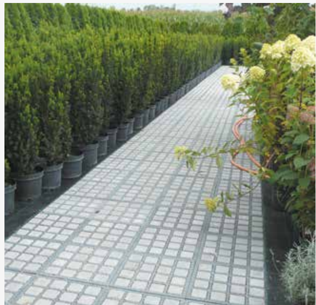
Flexibel, modern und dabei kostensparend